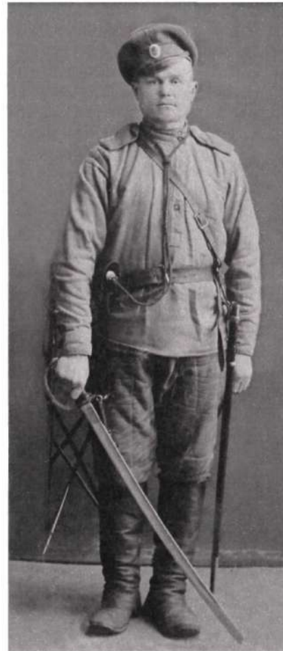
Фото 1915 года, г. Кишинев (Бессарабия)

Впоследствии фамилия Крдыковых распалась на фамилии, происходящие от имени отца.